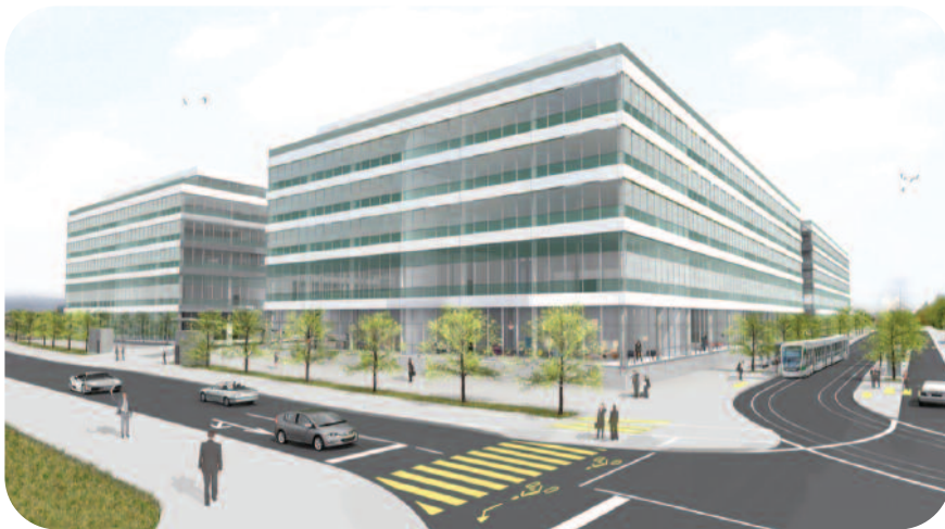
Vue générale de l'ensemble Espace Tourbillon avec la rue de la Galaise et le futur tram 15 à l'arrêt Tourbillon.

Totalisant plus de 78'000 m 2 de surfaces mixtes, Espace Tourbillon conjugue infrastructures industrielles et espaces publics pour offrir un cadre de travail moderne et convivial au cœur du pôle d'attractivité et de dynamisme qu'est la ZIPL0.