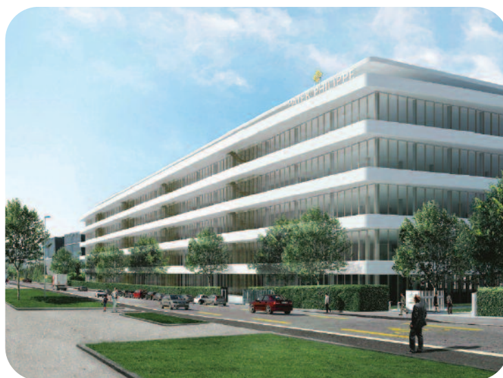
Détail de la façade du futur bâtiment PP6 de Patek Philippe.

Les parkings perdus en raison de ce chantier ont été déplacés vers un parking provisoire de 300 places sur un terrain aménagé en face du giratoire route de Base/Galaisie. Conçu spécialement pour l'occasion afin d'être exploité jusqu'à la fin du chantier (deuxième semestre 2018), ce parking disposera d'un marquage des places au sol, de lumières, de surveillance vidéo et n'est accessible qu'aux collaborateurs Patek.