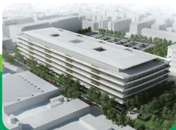
Vue d'ensemble du futur bâtiment.