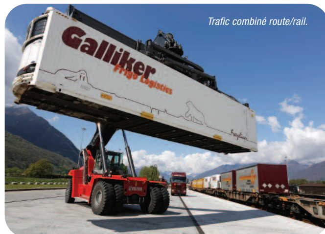
Trafic combiné route/rail.