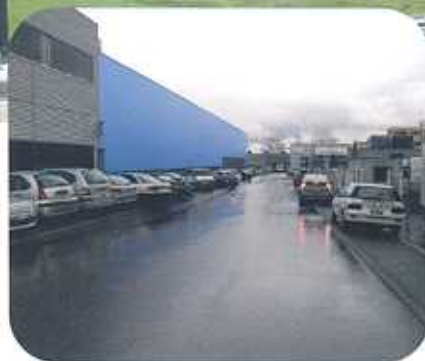
Récurrents, les problèmes de parquage et tout n'est pas encore construit... Qu'en sera-t-il demain?

Notre espoir est justifié par la récente décision de créer un atelier d'écologie industrielle, qui sera organisé en collaboration avec la Commune, la FTI, le Département du territoire et de l'Aziplo, sous le label ECOSITE et dans l'esprit de la loi sur l'Agenda 21.