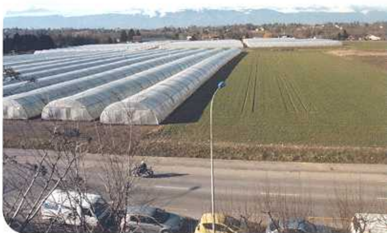
Ces deux vues prises depuis le toit des Laiteries Réunies démontrent que la distance pour relier les serres par une canalisation, est vraiment négligeable.

Il en va de même pour la consommation éner- gétique et électrique.